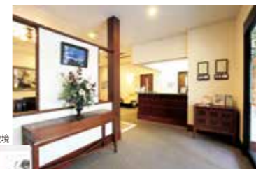
▼メディカルフィットネスクラブ武蔵境